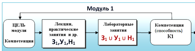
Рисунок 1. Логическая схема формирования первого модуля

Результат деятельности – это конструкторские документы в виде плоских изображений (чертежей), поэтому уровень сформированности компетенции К1 определяется уровнем созданных конструкторских документов.