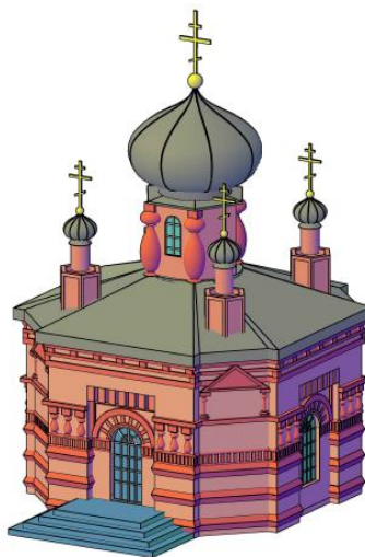
Рисунок 2. 3D-модель часовни Марии Магдалины