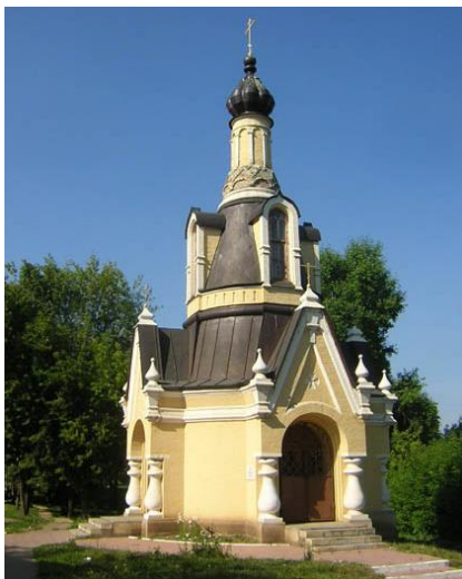
Рисунок 3. Фото часовни Михаила Архангела