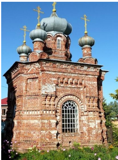
Рисунок 1. Фото часовни Марии Магдалины