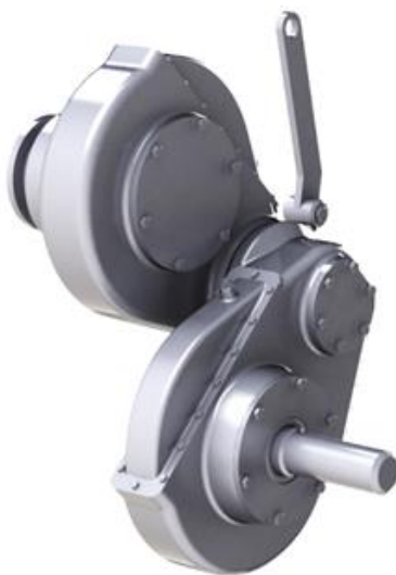
Рисунок 2. Сдвоенный бортовой редуктор в крайнем рабочем положении его составных частей, обеспечивающих перемещение колеса по высоте

Интерес подстегивается еще и тем, что это изделие является необычным как по своему дизайну, так и по функциональному назначению. Представленная конструкция сдвоенного бортового редуктора позволяет, наряду со своим прямым назначением, приводить во вращение несомое им заднее ведущее колесо трактора, передавать на колесо крутящий момент, а также перемещать его по высоте.