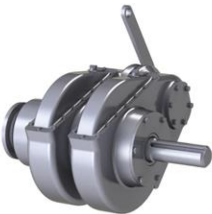
Рисунок 1. Сдвоенный бортовой редуктор в исходном положении его составных частей

демонстрировать широкие возможности современного проектирования в практике реального создания новых изделий. Яркие примеры решения практических задач на основе 3D-моделей будут способствовать возрастанию интереса студентов к изучению и компьютерной графике, и лежащей в ее основе начертательной геометрии, с которой в вузе начинается изучение этого современного раздела инженерной графики.