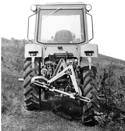
Рисунок 6. Обеспечение вертикального положения трактора на склоне за счет перемещения одного из колес заднего моста по высоте

тора был выполнен сочлененным из двух частей (рисунки 3 и 4). Одна из них устанавливалась на корпус трансмиссии заднего моста трактора и была связана с силовым гидравлическим цилиндром для осуществления ее управляемого поворота. Вторая, точно такой длины для обеспечения соосности валов, устанавливалась поворотной на первой части редуктора и кинематически связывалась посредством тяги и рычага с корпусом трансмиссии. Тяга и рычаг моделирова-