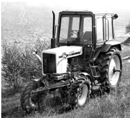
Рисунок 5. Трактор «Беларусь» с изменяемой геометрией ходовой системы для работы в условиях пересеченной и горной местности (во время испытаний на полигоне МТЗ, д. Абчак, Минский р-н)

торного редуктора было бы экономически нецелесообразно, а за счет модификации серийной модели трактора, массово выпускаемой Минским тракторным заводом, то обычный поворотный бортовой редуктор нарушал всю компоновку трактора, следовательно, и его возможности по агрегатированию с целым шлейфом технологических машин, навешиваемых на него сзади посредством специальной гидрофицированной конструкции (системы навешивания машин и орудий). Стояла задача в момент устранения этого недостатка сохранить компоновку базовой серийной модели трактора и все его возможности по агрегатированию.