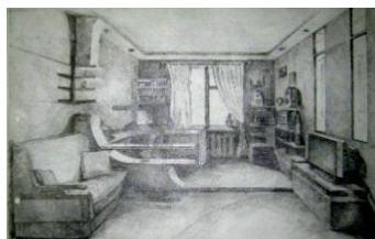
Рисунок 1. Угловая перспектива